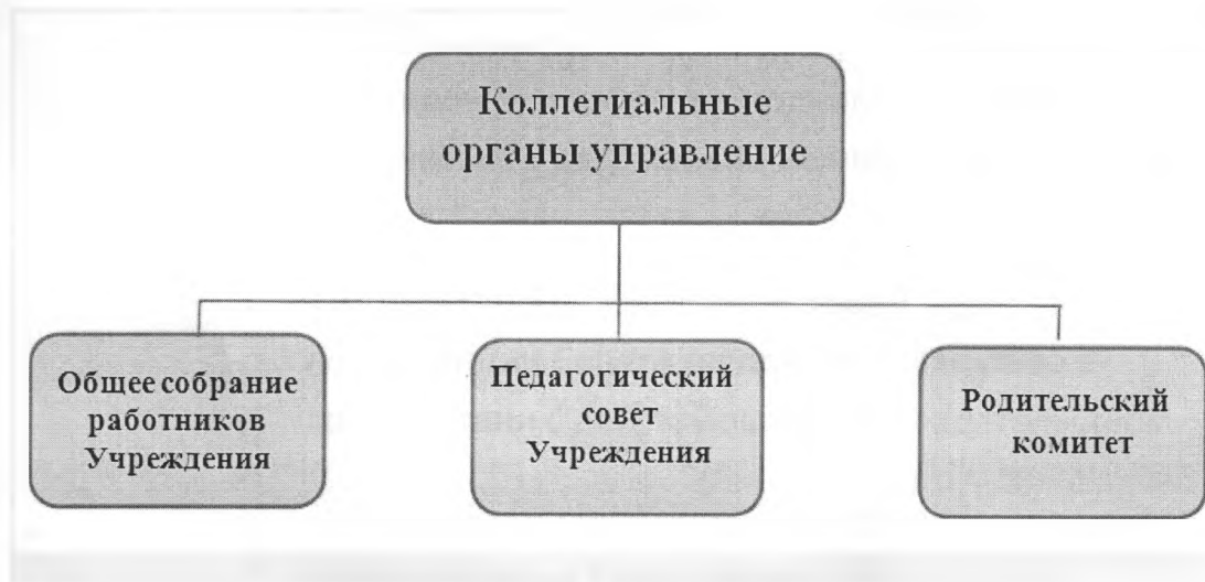
Схема 1. Коллегиальное управление ДОУ