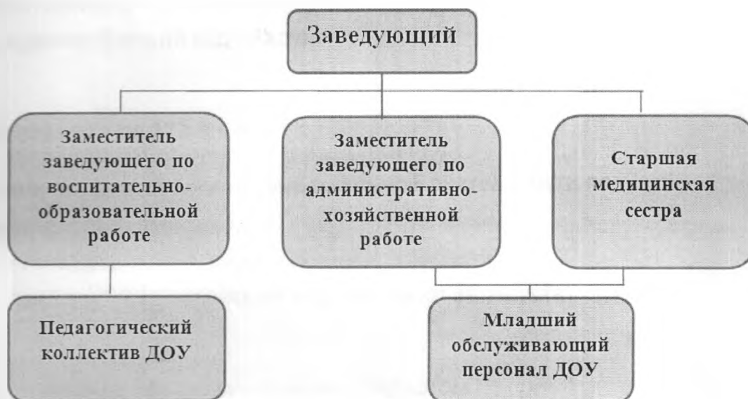
Схема 2. Административное управление ДОУ

- открывает лицевой счет (счет) в установленном порядке, в соответствии с законодательством Российской Федерации.